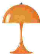
Tischleuchte „Panthella 250“ von Louis Poulsen, um 495 €