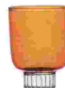
Weinglas „Liberta“ von Ichendorf Milano, über amorestore.de, um 19 €

Ritaglio stampa ad uso esclusivo del destinatario, non riproducibile.