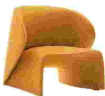
Sessel „Narinari“ von B&B Italia, um 3830 €

Tapete „Nuvolette“ von Fornasetti, um 510 €/2 Rollen