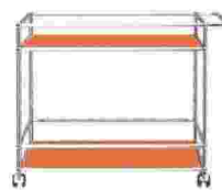
Barwagen von USM Haller, über designbestseller.de, um 860 €