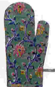
Coup de chaud Manique "Dinty Sauge" en coton, 16,5 x 33 cm, 30 €, JAMINI .

Alessio D'Amelio; Emiliano Gallo; presse