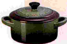
En solo Mini-cocotte en céramique, Ø 10 cm, 27 €, LE CREUSET .