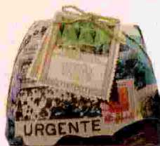
Noël transalpin Panettone à la crème de pistache, 900 g, 26,90 €, EATALY .