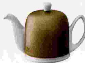
Le thé de la paix Née en 1953, la théière "Salam" revêt une cloche couleur bronze, 145 €, DEGRENNE .