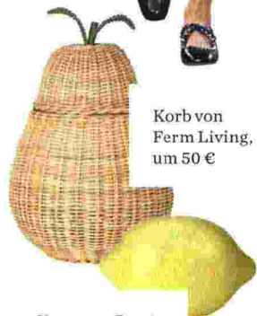
Korb von Ferm Living, um 50 €