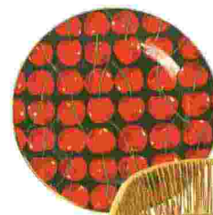
Porzellanteller von La Double J. Duo um 110 €

OBST MACHT GLÜCKLICH? Oh ja, denn gerade Sommersorten wie Ananas, Kirschen oder Melonen enthalten einen hohen Wert an Tryptophan – das hilft, das Glückshormon Serotonin zu bilden. Die Designer lassen sich davon inspirieren und entwerfen Stimmungsbooster fürs Zuhause: von der Leuchte über Tableware bis zum Balkonstuhl – in organischen Formen und in Farben von Bananengelb bis Maracuja-Orange. Und das ganz ohne Ablaufdatum: Die aufhellende Wirkung bleibt, auch wenn die warmen Tage zu Ende gehen.