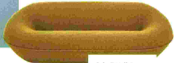
Sofa „Tortello“ von B&B Italia, ab 4980 €