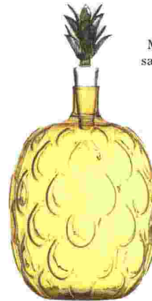
Glaskaraffe von Ichendorf Milano, um 46 €