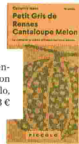
Melonensamen von Piccolo, um 3 €