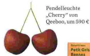
Pendelleuchte „Cherry“ von Qeeboo, um 590 €

Obst als Deko: Zitronen (vor allem die Sorte Amalfi) ein- fach auf Tellern drapieren