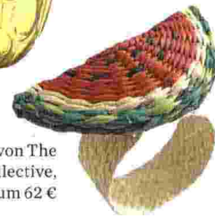
Serviettenring von The Colombia Collective, 4er-Set um 62 €