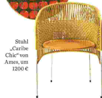
Stuhl „Caribe Chic“ von Ames, um 1200 €

Ritaglio stampa ad uso esclusivo del destinatario, non riproducibile. REDAKTION: JULIAN TIEFENBACHER 126361